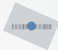
ブルードット照準